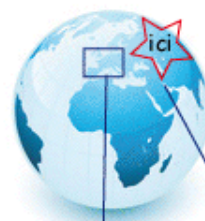
ROYAUME UNI MALTE IRLANDE ESPAGNE GRECE PAYS BAS ITALIE