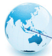
EMIRATS ARABES UNIS